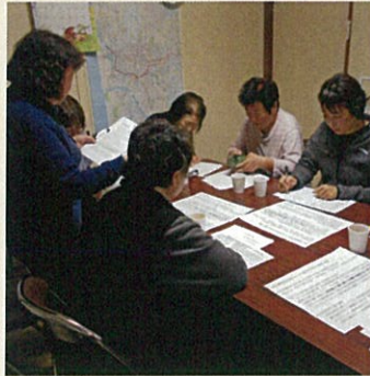
パーキンソン病の勉強会