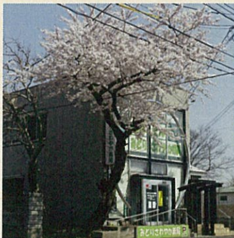
さわやか薬局前の桜