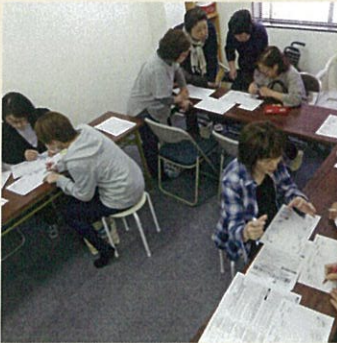
ワールドカフェ方式で