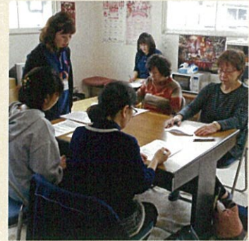
生活不活発病の勉強会