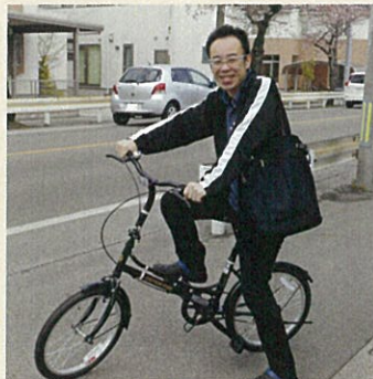
ポートセンターの新車♪