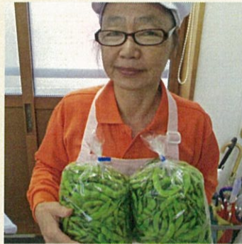
収穫の合間にヘルパーしてます