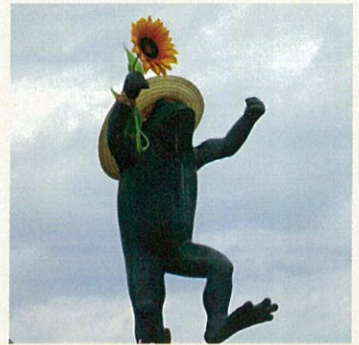
夏のももさだカエル