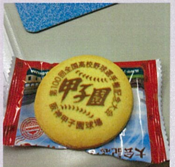
感動をありがとう！！！！