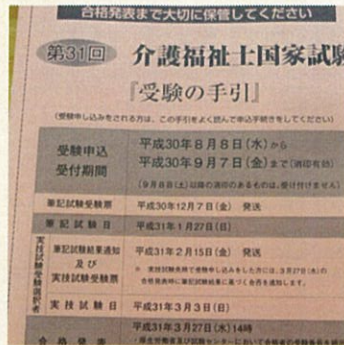
まだ間に合いますよ