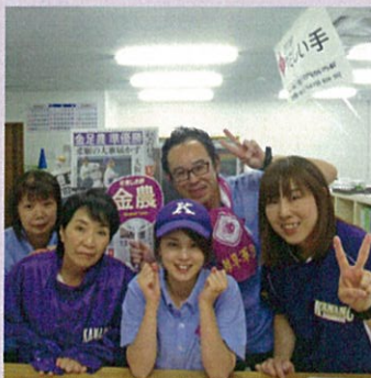
準優勝おめでとう！！