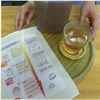
熱中症対策を忘れずに