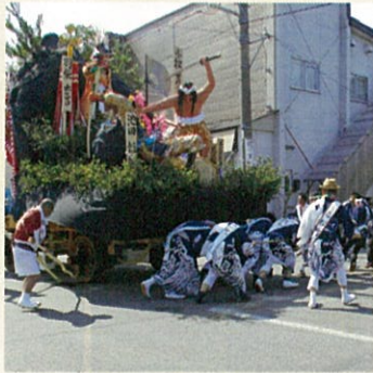
事務所近くで‘ジョヤサ’