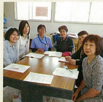
自立支援の勉強会