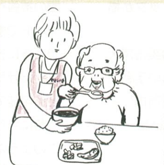
描いたのはダレでしょう？