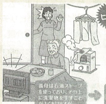
ストーブのヒヤリ