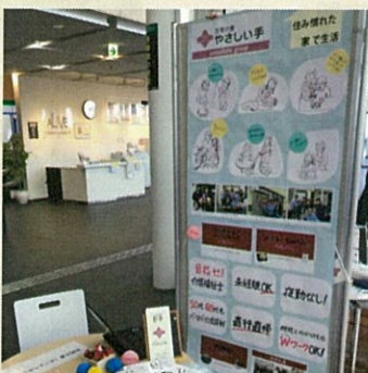
介護フェアに出展しました