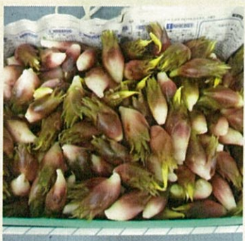
茗荷の大収穫（S店長宅）