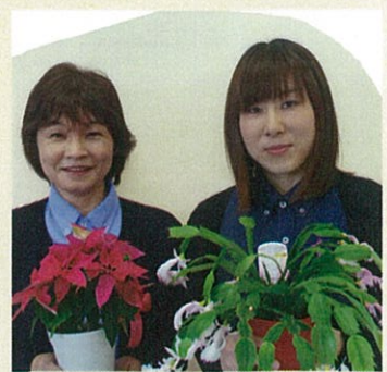
ラベンダードールが見ごろです