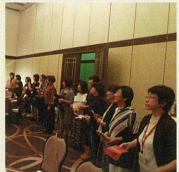
輪になってプレゼント交換