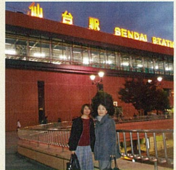
仙台で発表してきました