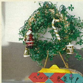
サンタさんをお願い!