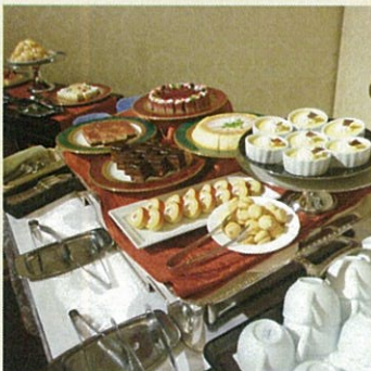
お楽しみのケーキバイキング