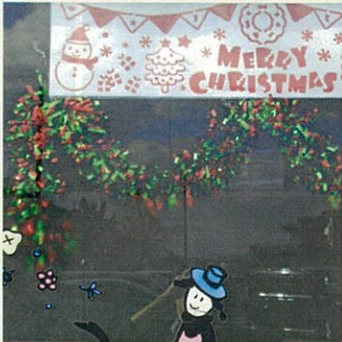
クリスマス仕様のももさだ店

vol.103 在籍介助 やさしい手 2018年12月22日発行 やさしい手秋田新聞委員会