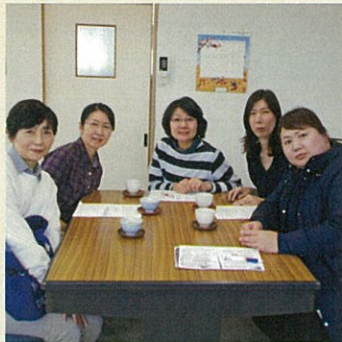
生活援助のグレーゾーンを勉強