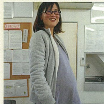
“マタニティフォト”