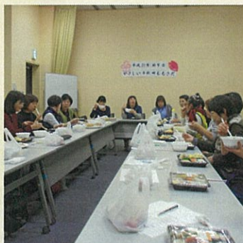
たのしい時間はあっという間