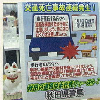
歩行者ファースト