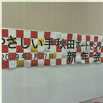
新年会を開催しました