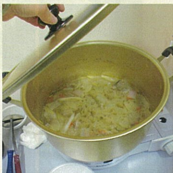
！店長お手製の豚汁