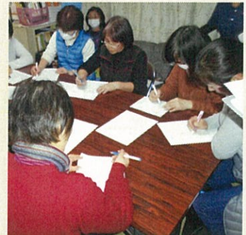
報告について勉強中