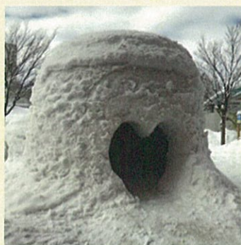
もうすぐ春ですね