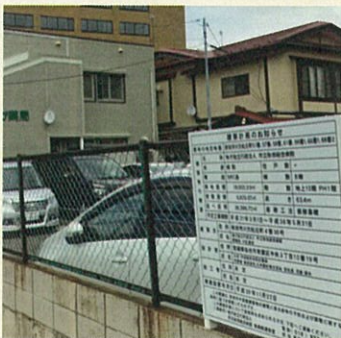
市立病院の改築計画