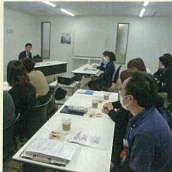
知的障がいの研修会