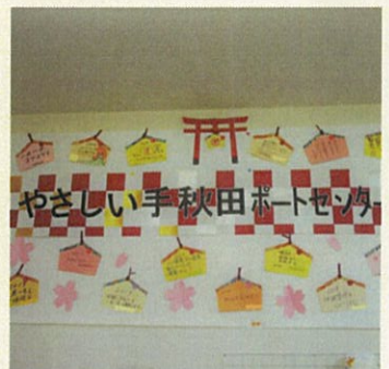
ポータルセンターの絵馬