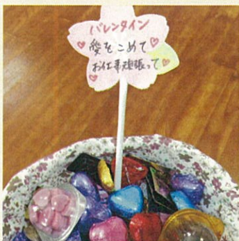
バレンタインのももさだ店