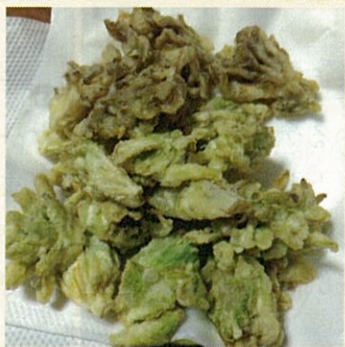
天ぷらになりました