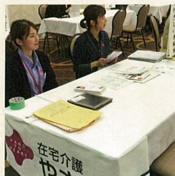
介護のしごとフェアに参加