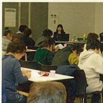
コンプライアンス研修