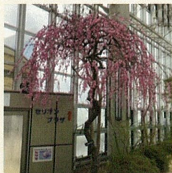
セリオンのしだれ梅