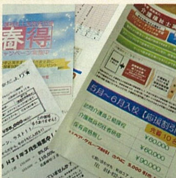
“実務者研修”各校募集中